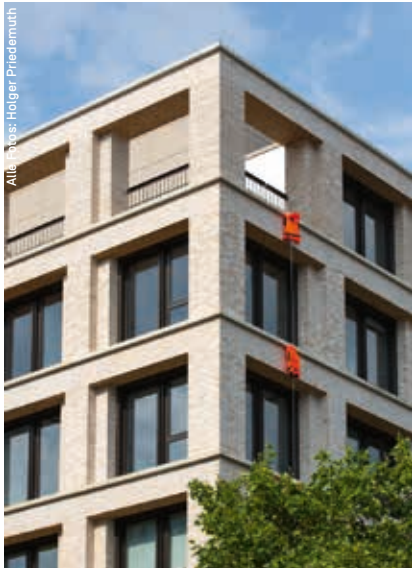
Am Tag des Sommerfestes zierten Rettungswesten – Symbol der Seebrückenbewegung – das medico-Haus.

Das von der Stiftung finanzierte medico-Haus ist schon jetzt zu einem Ort kritischer Öffentlichkeit geworden