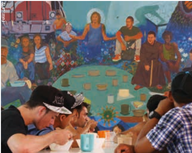
In der Herberge „La 72“ finden Migranten Schutz und Ruhe.

Drei beispielhafte medico-Projekte, die von der Stiftung gefördert wurden