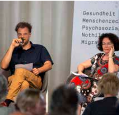
Die medico-Debatten waren den ganzen Tag über gut besucht.

es sich – und hierfür war das Sommerfest bester Beleg – schon nach wenigen Monaten zu einem Ort von Begegnung, solidarischem Austausch und kritischer Öffentlichkeit entwickelt.