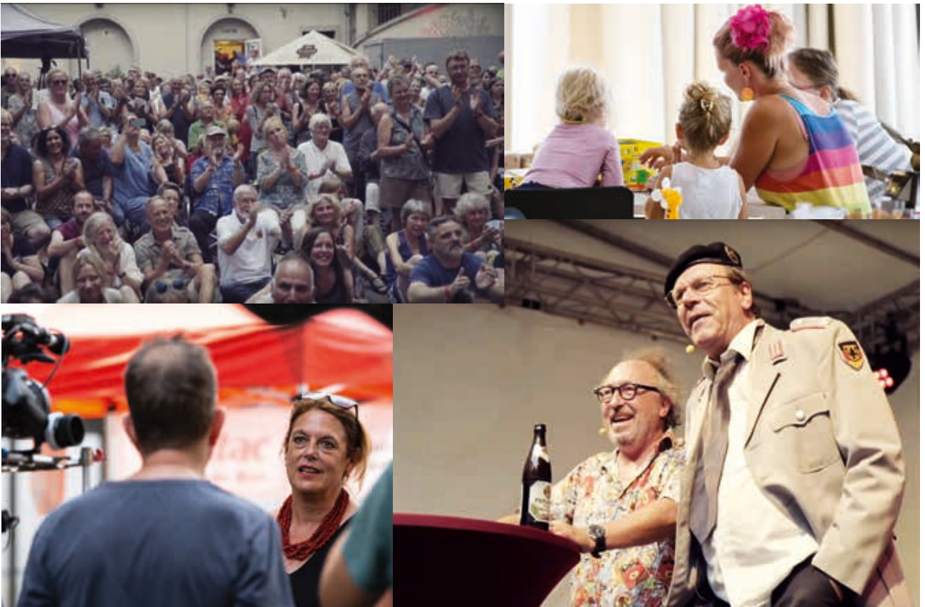
Volles Programm: Von Kinderangeboten bis zum Auftritt von Kuratoriumsmitglied Georg Schramm und Kabarettistenkollege Urban Priol.

Die vielen medico-Veranstaltungen – von Lesungen, Podiumsdiskussionen und Ausstellungen bis hin zu Konferenzen, Vernetzungstreffen und politische Begegnungen –, die im Zuge des Jubiläumsprogramms in den „freien Räumen“ im Erdgeschoss stattgefunden haben, waren allen Unkenrufen ob der Lage des Gebäudes im Frankfurter Osten zum Trotz fast ausnahmslos gut besucht. Darüber hinaus nutzen verstärkt andere Akteure aus der Stadt die Räume für eigene Veranstaltungen, seien es Gewerkschaften, Verlage oder sozialökologische und friedensfördernde Institute. Die Hoffnung, medico könne mit dem Haus auch so etwas wie einen konkreten utopischen Raum schaffen, in dem auf vielfältige Weise und eben auch öffentlich für eine andere und gerechtere Globalität gearbeitet, gedacht und diskutiert wird, ist auf dem besten Weg, sich zu erfüllen.