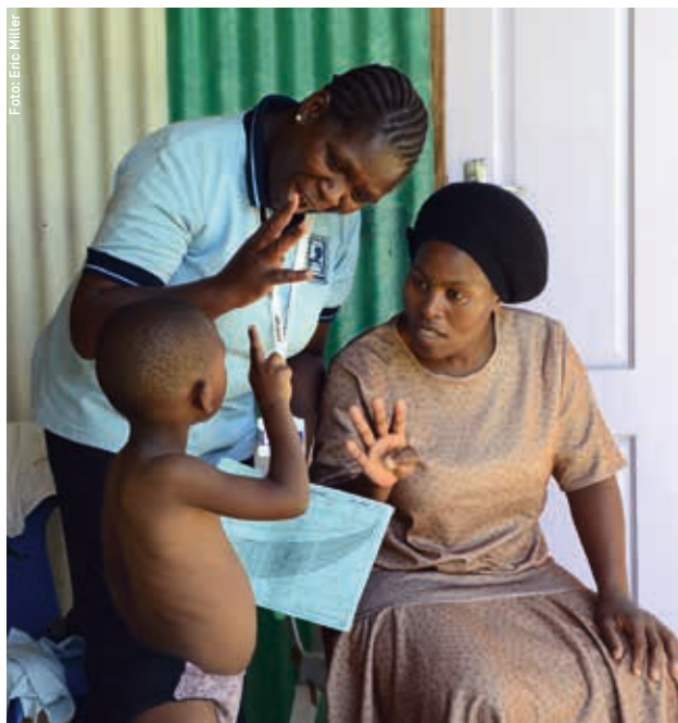
Unersetzlich: Basisgesundheitsarbeit in den Gemeinden.