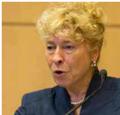
Gesine Schwan stellte ihr vieldiskutiertes Modell eines europäischen Integrationsfonds vor.

Ankunftsstädte von Abermillionen Neuangekommenen. Und überall fordern diese Neuankömmlinge die Gleichheit der Rechte ein.“ Es steht also nicht mehr zur Debatte, ob Städte mit dieser Herausforderung umgehen sollen. Es kann nur noch darum gehen, wie sie ihr begegnen.