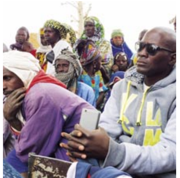
Assemblées paysannes dans les villages de Tikerre Moussa et Kourouma (tous deux au Mali), 2015/2016.