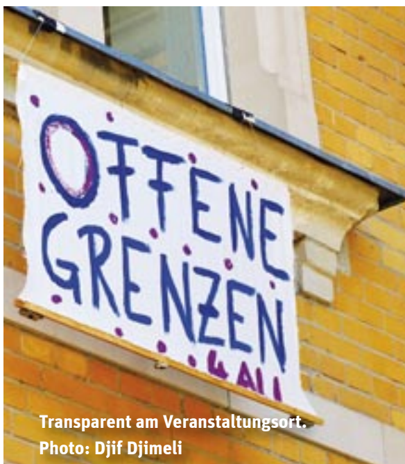
Transparent am Veranstaltungsort.