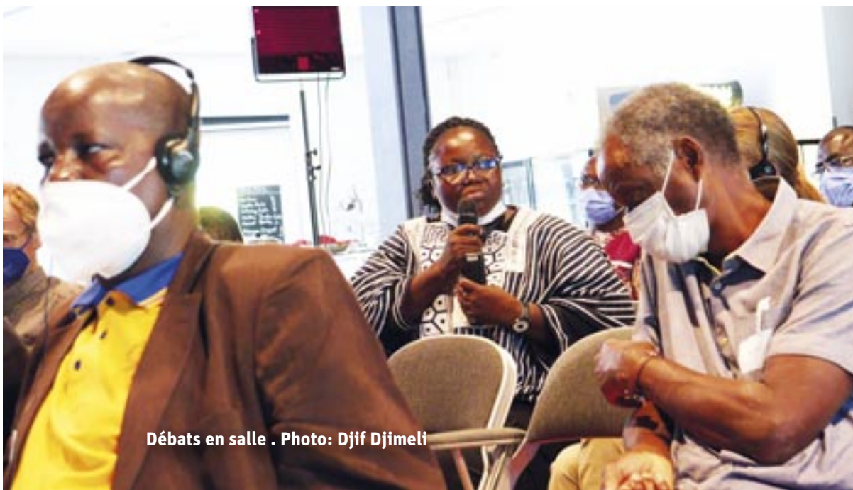
Débats en salle .