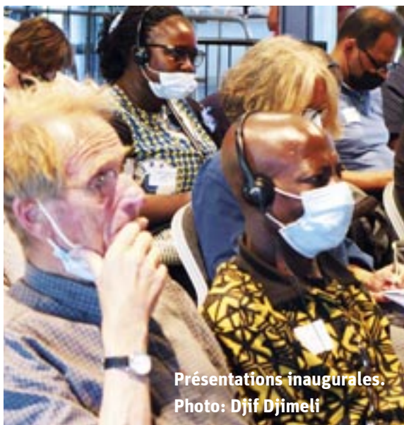
Présentations inaugurales.

de gestion des ressources naturelles rares comme les terres et l'eau – la crise actuelle pourrait être rapidement surmontée. Telle fut la conclusion optimiste du discours d' OUSMANE SY .