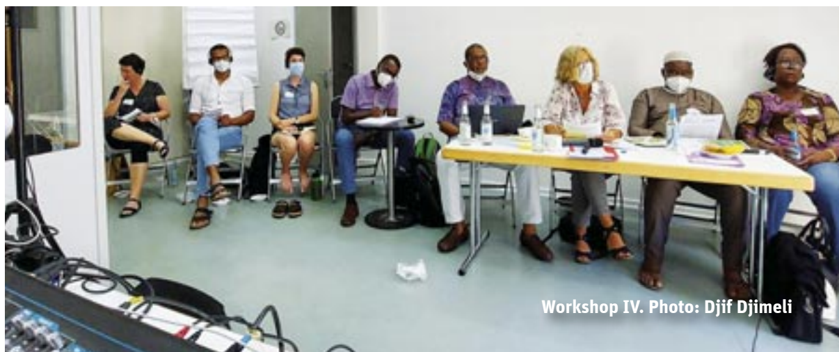
Workshop IV.

Au cours de la discussion qui a suivi, les intervenant·es étaient d'accord sur les principaux points. Plusieurs intervenant·es ont souligné la nécessité de s'engager pour la liberté de la presse. Ils ont aussi insisté sur la nécessité d'informer les populations sur l'ensemble des sujets importants, y compris dans les langues locales. Des pays européens, il a été dit qu'ils devraient garantir la protection des opposants qui risquent leur vie en restant dans leur pays en les accueillant sans délai, sans fastidieux processus de demande de visa. ●