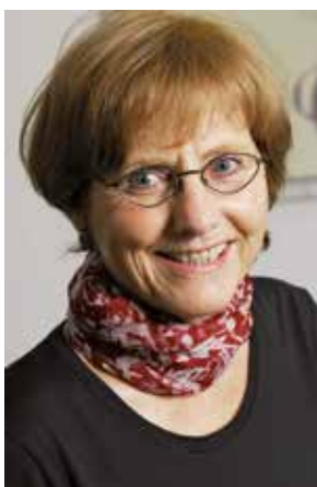
Brigitte Kühn Presidenta