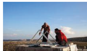
Mitarbeiter von Comet-Me errichten eine Energieanlage im Westjordanland

Diese Befürchtung teilen offenbar auch die Diplomaten der Europäischen Union. Im Januar verfassten sie einen Bericht, in dem sie auf die zunehmende Isolierung der Palästinenser in den C-Gebieten und ihre fortschreitende Verdrängung hinwiesen. Sie empfahlen der EU, mehr Geld in die Entwicklung palästinensischer Projekte in dieser Zone zu investieren, um damit der weiteren Marginalisierung der palästinensischen Bevölkerung entgegen zu wirken. Alnatour appelliert an die Bundesregierung, ihren Einfluss innerhalb der EU geltend zu machen, um die Vertreibung der Palästinenser aus den ländlichen Gebieten des Westjordanlandes zu stoppen.