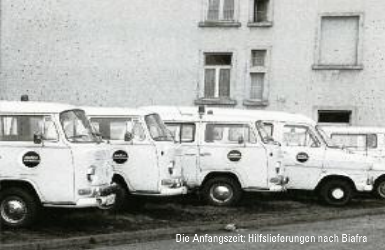
Die Anfangszeit: Hilfslieferungen nach Biafra