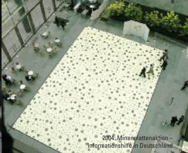
2004:minenplattenaktion – Informationshilfe in Deutschland