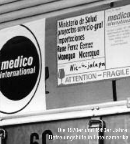
Die 1970er und 1980er Jahre: Befreiungshilfe in Lateinamerika