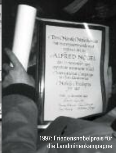
1997: Friedensnobelpreis für die Landminenkampagne