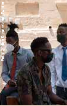
Die drei Angeklagten am Gericht. Ihr Fall ist nur einer von vielen, in denen Helfer:innen und Geflüchtete kriminalisiert werden.