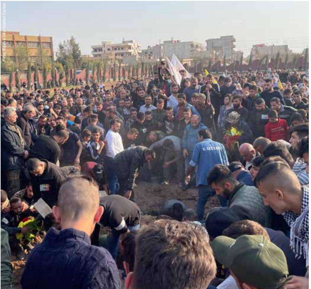
Die Beerdigung der Opfer des türkischen Drohnenangriffs vom 9. November wurde zur Protestaktion.

Die Bevölkerung lebt in einer zermürbenden Ungewissheit. Dabei werden die Türkei und ihre isla-