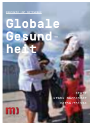
2 NEUAUFLAGE: Broschüre Globale Gesundheit