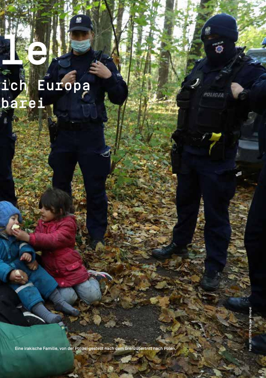
Eine irakische Familie, von der Polizei gestellt nach dem Grenzübertritt nach Polen.