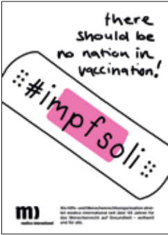
1 NEU: Flyer und Plakat zur Kampagne #impfsoli