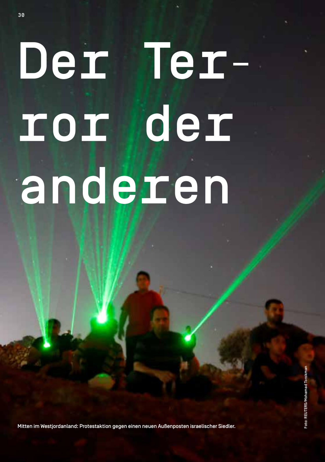
Mitten im Westjordanland: Protestaktion gegen einen neuen Außenposten israelischer Siedler.