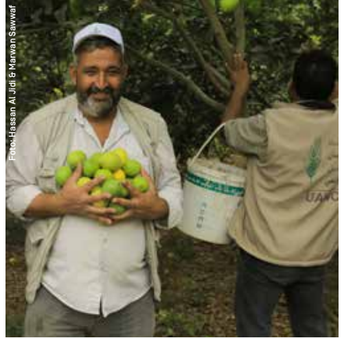
Reiche Zitronenernte bei der medico-Partnerorganisation UAWC.

Zwischenzeitlich hat der Militärgouverneur der Westbank die Entscheidung, sechs palästinensische NGOs per Handstreich zu terroristischen Gruppierungen zu erklären, in das dortige System des Militärregimes überführt. Damit ist alles möglich: willkürliche Inhaftierungen der Betroffenen, die Beschlagnahme von Vermögenswerten der Organisationen und dauerhafte Schließung ihrer Büros. Betroffen sind die medico-Partnerorganisationen Union of Agricultural Work Committees (UAWC) und Al-Haq. UAWC unterstützt palästinensische Bauern- und Hirtenfamilien in den von Israel kontrollierten C-Gebieten des Westjordanlands, in dem die meisten Siedlungen gebaut werden. Al-Haq dokumentiert Völkerrechtsbrüche und Menschenrechtsverletzungen – in der aktuellen Kooperation mit medico zum Beispiel die durch Sicherheitsdienste der Palästinensischen Autonomiebehörde bei der Niederschlagung regierungskritischer Demonstrationen im Sommer 2021.