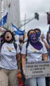
Während in Nicaragua Scheinwahlen stattfanden, protestierten exilierte Nicaraguaner:innen in San José, Costa Rica.