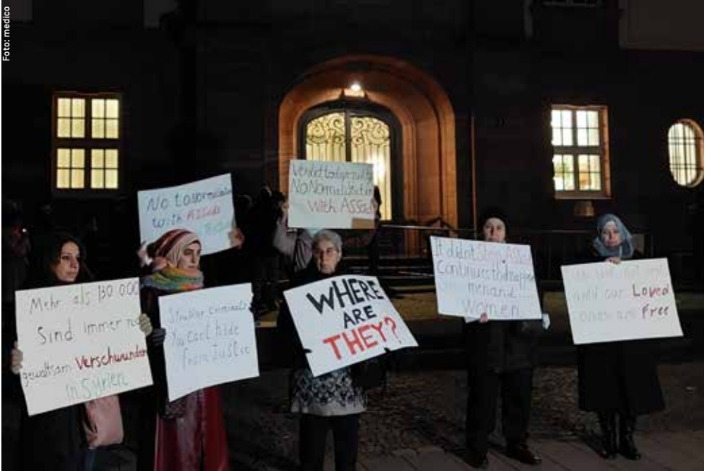
Vor dem letzten Prozesstag in Koblenz.