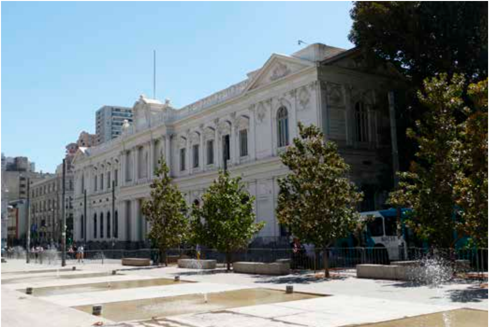
Im ehemaligen Parlamentsgebäude in Santiago tagt heute der Verfassungskonvent.