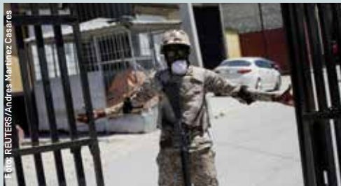
Kein Durchkommen an der haitianisch-dominikanischen Grenze.