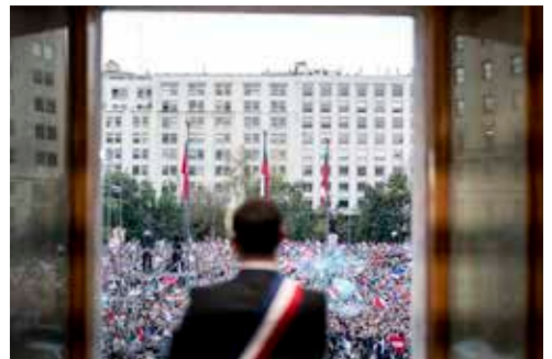
Der neue Präsident Boric hält seine Antrittsrede von der Moneda aus.