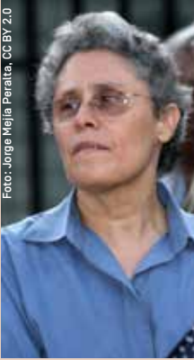
Dora María Téllez.