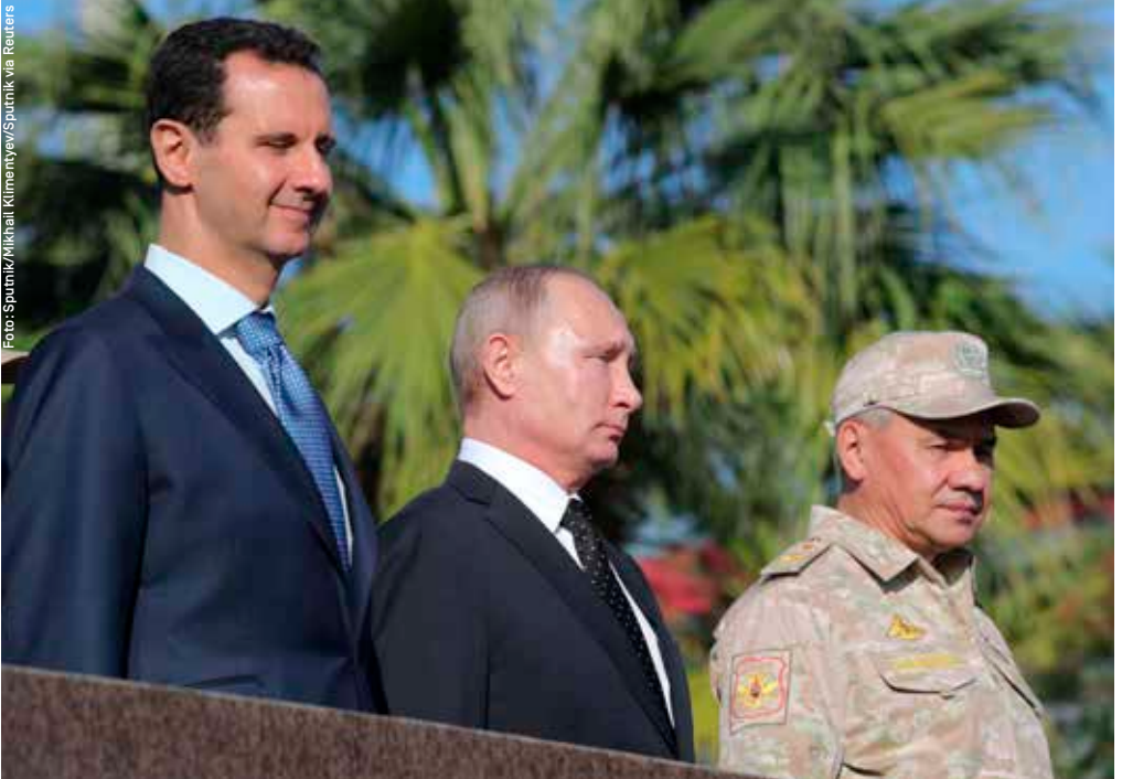
Er hat gut Lachen: Putins Intervention in Syrien hat Assads Überleben gesichert.

kratie hinlänglich zum Ausdruck gebracht hat. Das putinistische Russland hat auch nie einen Hehl aus seiner Feindseligkeit gegenüber dem „Arabischen Frühling“ gemacht.