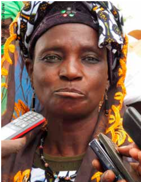
Immer wieder kommt es zu Protestaktionen: Die Bevölkerung hat genug von der staatlichen Korruption.

Die Putschs unterscheiden sich. Und doch gibt es gemeinsame Ursachen, wie ein Blick zurück zeigt: Zum Zeitpunkt der Unabhängigkeit sahen sich die neuen Regierungen mit dem Umstand konfrontiert, dass die vorkolonialen politischen Institutionen weitgehend zerschlagen waren – samt jener kulturell tief verankerten Mechanismen, die für eine Ausbalancierung widerstreitender Interessen sorgten. Hinzu kam, dass sich die wirtschaftliche Basis der Sahelländer als äußerst schwach erwies, vor allem war sie weit davon entfernt, die im Unabhängigkeitsprozess geweckten materiellen Erwartungen der Bevölkerung befriedigen zu können. Zusammen führte dies zu einer fatalen Dynamik: Zunächst übernahmen die jungen Unabhängigkeitseleiten den kolonialen