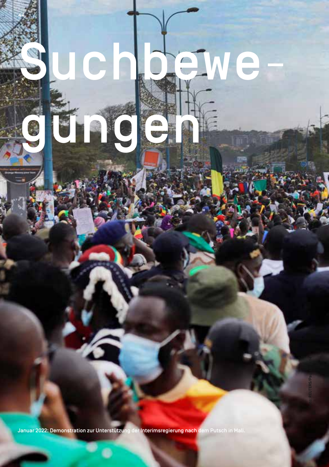
Januar 2022: Demonstration zur Unterstützung der Interimsregierung nach dem Putsch in Mali.