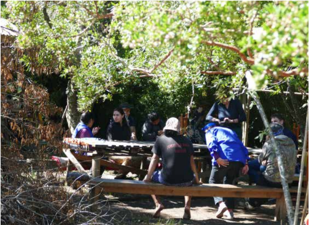
Mapuche-Landbesetzer:innen bei einer Besprechung in Llazqawe.

Beim Ausleihen des Wagens am Flughafen von Temuco, der Hauptstadt Araucanías, heißt es, wir sollten vorsichtig sein, wenn wir einen Holztransporter vor uns haben. Denn die Region ist Extraktivismusland für Holz, was gute Fahr-