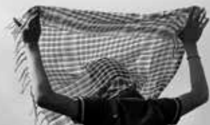
Am Stadtrand von Kobanê 2015.