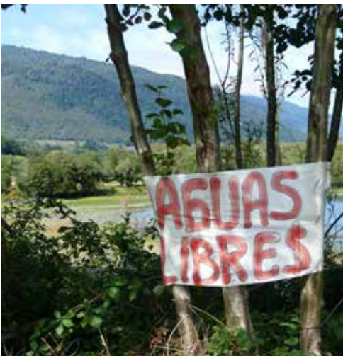
Freie Wasser – eine landesweite Forderung.