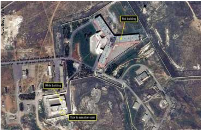
Luftaufnahme des Gefängnis Komplexes Al Khatib.